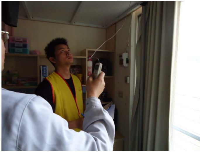
1.測試儲值卡機與冷氣機運轉狀況