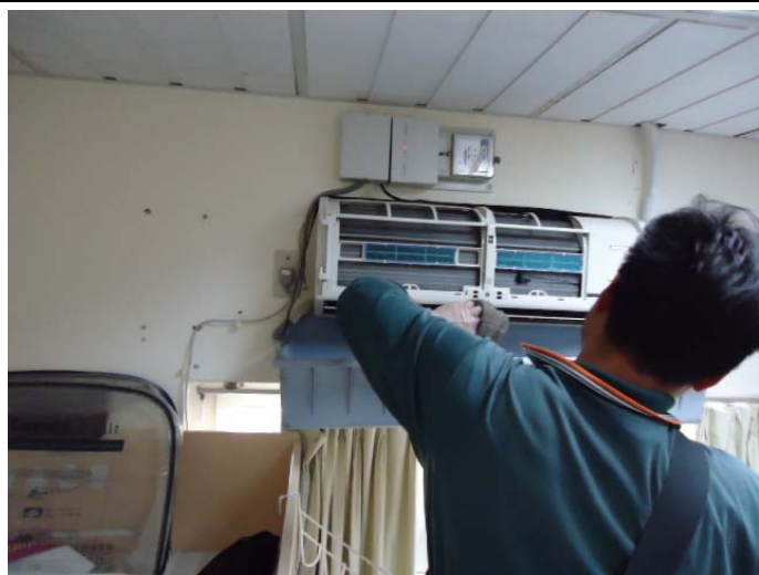
9.擦乾蒸發器與擦拭機體