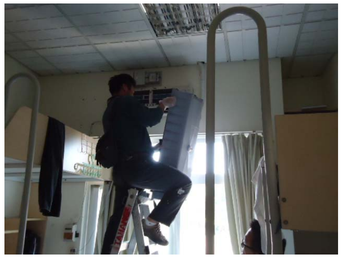
2.拆卸室內機面板與濾網